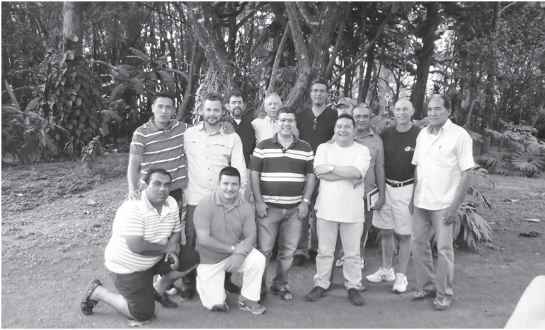
ASAMBLEA GENERAL DE LA IGLESIA REFORMADA EVANGÉLICA PRESBITERIANA (IREP) EN COLOMBIA 2016