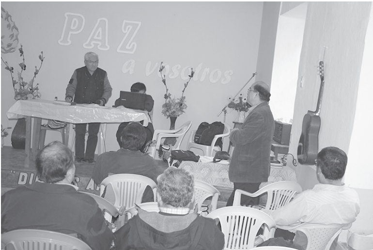
ASAMBLEA GENERAL DE LA IGLESIA EVANGÉLICA PRESBITERIANA DEL PERÚ 2016