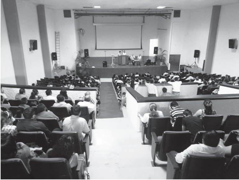
CONFERENCIAS EN CUNDUACÁN TABASCO, MÉXICO