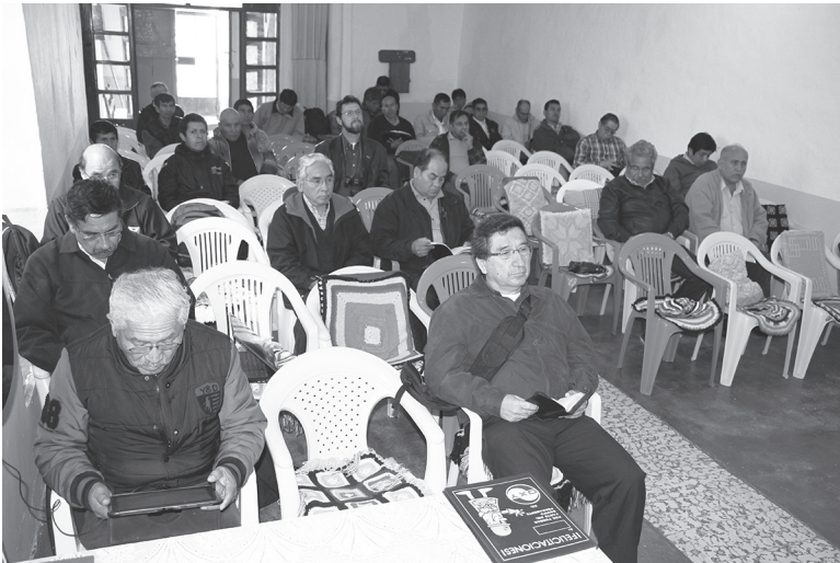
ASAMBLEA GENERAL DE LA IGLESIA EVANGÉLICA PRESBITERIANA DEL PERÚ 2016

varias dificultades legales que hemos decidido enfrentar de manera activa, con fe en la justicia divina, y en la diligencia de su santos. Gracias a Dios, la gran mayoría de acuerdos tomados fueron por una contundente unanimidad, obra del Espíritu del Señor. Alabado sea el Dios de la Gloria. Nuestro presidente sigue siendo el Pastor