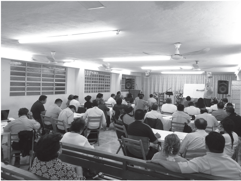
CLASE SOBRE "PREDICANDO A CRISTO DESDE EL AT" EN MÉRIDA, YUCATÁN MÉXICO - ENERO, 2016